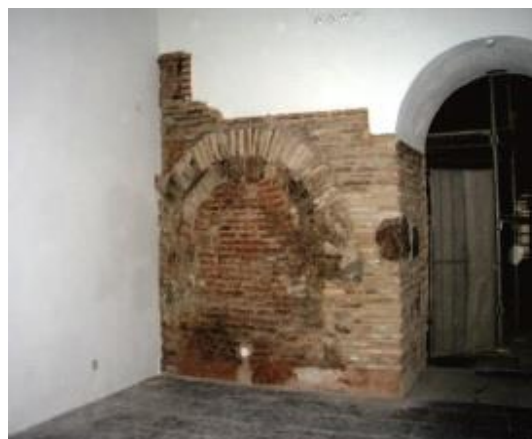
Рис.10. Автентичне мурування Успенського собору Києво-Печерської Лаври.

Зволоження стін виникає в разі існування пошкодження водостічних труб та жолобів. Деякі види пошкоджень визначається візуально: зокрема, помітний нахил дахів чи сходів свідчить про наявність деструктивних елементів і конструкцій, які вимагають заміни.