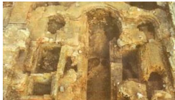
Рис.8. Автентичні фундаменти Михайлівського Золотоверхого собору.

Аварійний стану основ і фундаментів є основною причиною порушення статичності будівлі і появою тріщин в конструкціях.