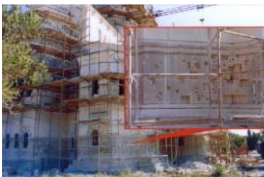
Рис.11. Фрагмент мурування Володимирського собору в Херсонесі.