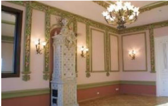
Рис.3. Відреставровані опалювальні прилади «Будинку з химерами».