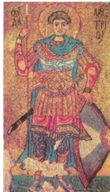
Рис.6. Мозаїки Михайлівського Золотоверхого собору після відтворення.