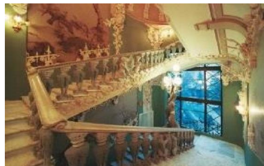
Рис.2. Інтер'єр сходової клітки «Будинку з химерами»(після реставрації).