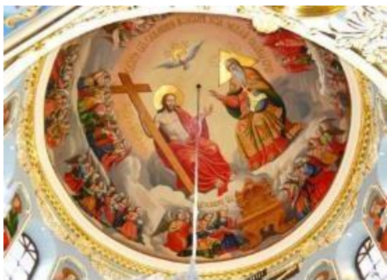
Рис.7. Відтворений стінопис Успенського собору.

Методика системно-структурного аналізу покладена і в основу аналізу існуючої практики реставраційних робіт на пам'ятках архітектури. Структурно-логічні моделі виконують роль змістового наповнення інформаційної структури експертної системи реставраційних робіт.