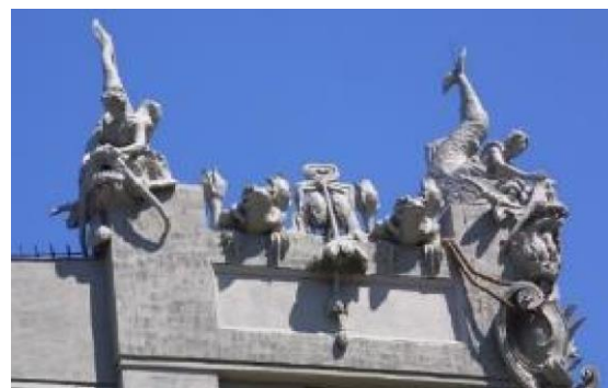
Рис.5. Скульптури на даху «Будинку з химерами (стан після реставрації)».

В цьому ряду аналізуються всі ліпні деталі, рельєфи, колона, арка (якщо вони виконують суто декоративні функції), мозаїчні композиції на стелях і стінах, мозаїчні підлоги, живопис на внутрішніх і зовнішніх поверхнях. Кожний елемент – складник також реставрується за розробленими реставраційними методиками.