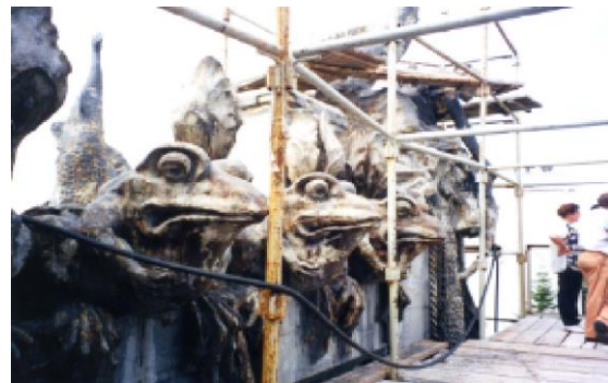
Рис.4. Скульптури на даху «Будинку з химерами (стан до реставрації)».

На прикладі «Будинку з химерами» показано, що охоронні і реставраційні заходи охоплювали як загальний зовнішній і внутрішній вигляд будівлі, такі окремі компоненти і елементи включно з обладнанням [2].