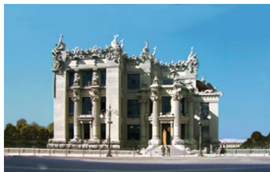
Рис.1. Загальний вигляд «Будинку з химерами» на вул. Банковій,10 (після реставрації).

Системний підхід передбачає розчленування цілісного об'єкту дослідження – будівлі з розглядом окремих аспектів – екстер'єр, інтер'єр, монументально-декоративне мистецтво, та на основні конструктивні елементи – дах, завершення, стіна, фундамент [2]. На основі системно-структурного аналізу створюються окремі інформаційно-логічні моделі предмету охорони, тобто моделі, які визначають, що саме в будівлі підлягає охоронним заходам і відповідно реставрації. Оскільки предметами охорони на першому рівні (зовнішні поверхні) є дах, завершення, стіна і фундамент, а в випадку внутрішніх поверхонь - стеля, стіна, обладнання, підлога, то можна заключити, що предметом охорони і реставрації є по суті поверхні (рис.1,2,3).