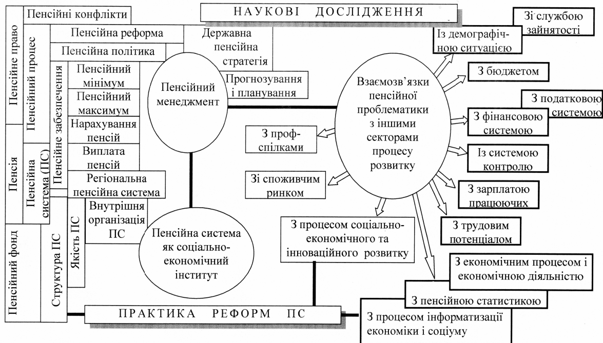
Рис.1 – Понятійно-категорійний апарат пенсійної системи як об'єкту наукового дослідження