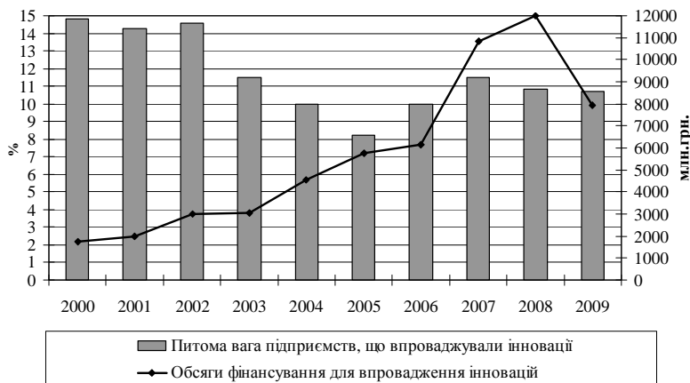
Рис.1 – Динаміка питомої ваги підприємств, що впроваджували інновації та обсягів фінансування інновацій в Україні за 2000-2009 рр.

Підтвердженням такого становища є наступні статистичні дані в Україні за 2000-2009 рр. (рис.1) [9].