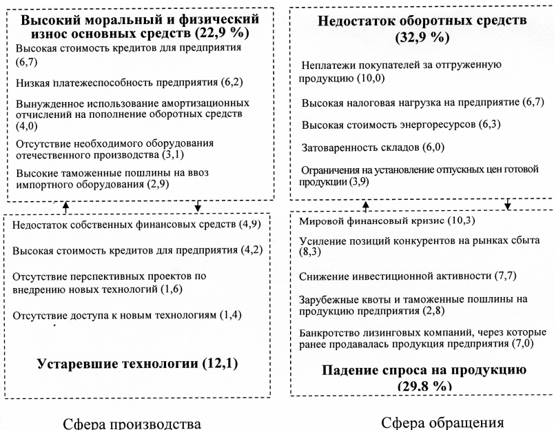
Рис. 2 – Факторы, сдерживающие воспроизводственные процессы на предприятии

В результате анализа ежегодно публикуемых данных о факторах, препятствующих внедрению инноваций на промышленных предприятиях, установлено, что наиболее существенно влияние таких факторов, как недостаток собственных денежных средств, высокий экономический риск, длительные сроки окупаемости нововведений, недостаток финансовой поддержки, низкий инновационный потенциал организаций (рис.2) [7].