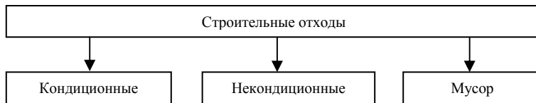
Рис. 1 – Разработанная общая классификация строительных отходов

Согласно рис. 1, к кондиционным строительным отходам были отнесены все конструктивные элементы, детали и изделия, пригодные к повторному применению для нового строительства или при ремонте, реконструкции зданий и сооружений. К некондиционным отнесли отходы, пригодные для переработки в строительные материалы с целью их использования при капитальном ремонте или новом строительстве. Кондиционные и некондиционные строительные материалы суммарно составляют до 95 % всех строительных отходов [1, 2].