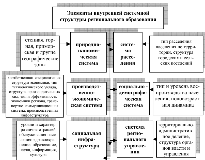
Рис.1 – Составляющие внутренней системной структуры региона

функция региона, любой социально-территориальной общности населения. В демократической системе территориальной организации социума регионы выступают в качестве равноправного субъекта социально-экономических отношений и наделены собственностью, имуществом и правами для реализации социально-экономических интересов населения регионов – создания необходимых условий для его социального воспроизводства [1, 3, 4]. Одновременно «центру» делегируется выполнение общих социальных функций, важных для каждого региона, – обеспечение прав и свобод граждан, национальной целостности и безопасности государства, общих правил экономической жизни. Между центром и регионами устанавливаются отношения партнерства и взаимной ответственности.