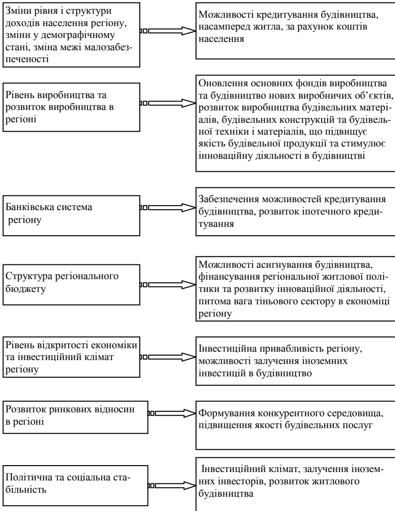
Рис.1 – Вплив факторів соціально-економічного розвитку регіону на розвиток будівництва в регіоні

- оцінка показників, що характеризують можливості утворення синергитичних ефектів в діяльності при поєднанні різних підсистем регіону.