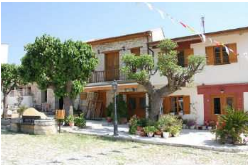
Рис. 5 – На Кипре сильна греческая традиция

Греческие традиции строительства жилья оказали влияние и на архитектуру Кипра (рис.5). Однако она, все же, отличается от греческой, и дома в кикладском стиле на острове скорее редкость.