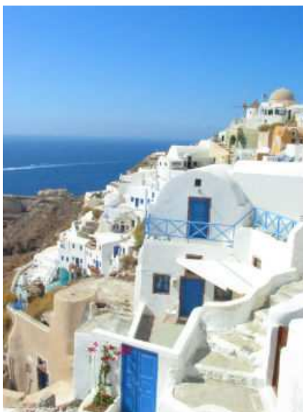
Рис. 2 – Бело-синий стиль Киклад

Когда говорят о средиземноморской архитектуре в Греции, то имеют в виду, прежде всего, «кикладский стиль». Именно на островах Кикладского архипелага зародилась традиция покраски стен домов белой штукатуркой, а оконных рам и дверей – синей или голубой краской. В целом лаконичные постройки выглядят очень ярко и празднично на фоне ослепительного греческого неба. С 1974 года все дома в этом регионе в обязательном порядке выкрашиваются в бело-синие цвета (рис. 2).