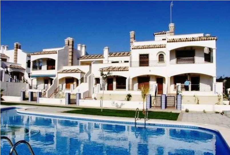
Рис. 6 – Испания, Валенсийское сообщество, комплекс Rocío

Многие виллы в Испании также представляют собой классику средиземноморской архитектуры. Правда для многих регионов характерны свои особые черты. Например, домам Андалусии присущи восточные мотивы: яркие цвета красных оттенков, башенки, балюстрады – так сказывается длительное присутствие арабов. А вот виллы Валенсийского сообщества имеют ярко выраженные черты средиземноморского стиля – ослепительно белые или бежевые стены, высокие лестницы, большие террасы (рис. 6).