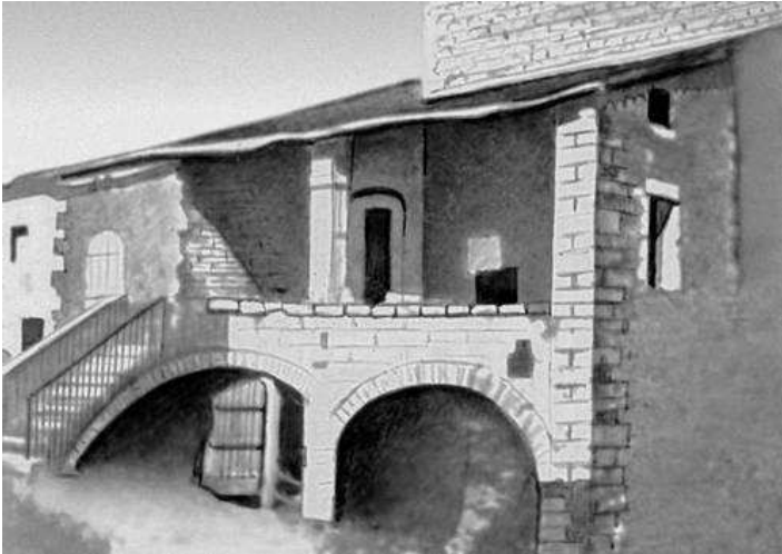
Рис. 3 – Дом средиземноморского типа

На второй этаж ведет внешняя лестница. Вход с продольной стороны. Перед входом лестница заканчивается небольшой площадкой или же ведет на вытянутую вдоль всей стены галерею. Разумеется, этот комплекс главных признаков, на основании которого производится классификация, на практике неизбежно дополняется, изменяется и варьирует в разных странах и областях Средиземноморья в зависимости от природных условий, хозяйственной деятельности населения и местных традиций (рис. 3).